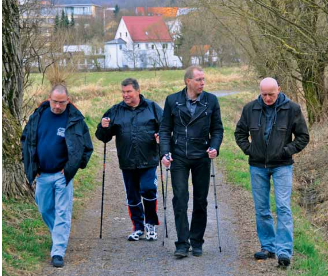
Beim ausgedehnten Spaziergang im Knüllwald tauschen sich die Kollegen über Fitness aus. Die Diebel-Truppe meint es mit den Nordic Walking Stöcken besonders ernst.

bauch. „Gerade die Männer sorgen sich mehr um den Motor ihrer Lkw als um ihren eigenen Körper“, warnt Laufersweiler und betont noch einmal: „Sie sollten sich so oft wie möglich bewegen, auch um den Darm anzuregen.“