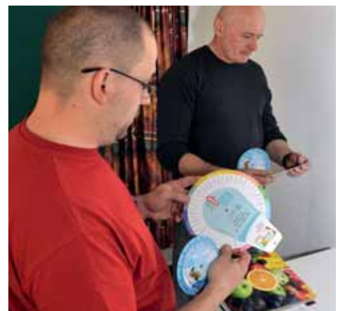
Der Kaloriengehalt lässt sich anhand einer praktischen Drehscheibe ermitteln.