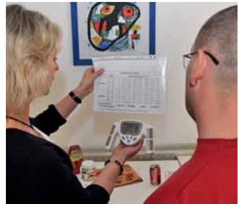
Bei der letzten Körperfettmessung liegen die Fahrer laut Tabelle im grünen Bereich.

Es ist ein Teufelskreis, denn Zucker sorgt dafür, dass viel Insulin ins Blut gelangt, was wiederum der Fettspeicherung dient. Geht das Insulin schnell zurück, entsteht neuer Hunger. Zu viel Zucker, zu wenig Bewegung sind gleich zu viele Kalorien, heißt: Speck-