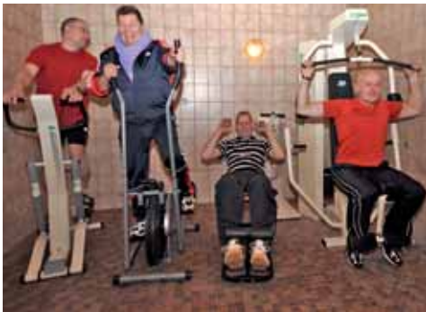
Spaß bringt am Abend die sportliche Er- tüchtigung im hoteleigenen Fitnessraum plus anschließendem Saunagang.